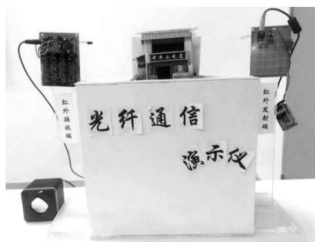
图 7 光纤通信演示仪

在前两步的基础上,指出光导纤维在生活中的具体应用——光纤通信 [9] ,并演示“光纤通信演示仪”(如图 7 所示):将手机与发射端相连对准接收端,手机播放歌曲,声音从接收端的音响发出,当遇到“房子”等障碍物时,歌声消失,教师利用光导纤维绕过障碍物连接两端,歌声再次出现。发射端将声信号转为光信号,接收端将光信号转为声信号,而光信号的传播就依靠光导纤维,由于前面学生已经理解了光导纤维弯曲导光的原理,因此理解光纤通信的工作过程就变得容易了。